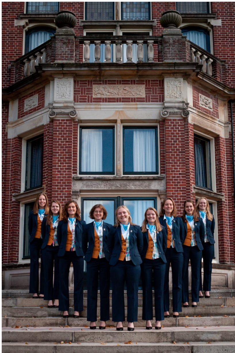
Eén van de bestuursfoto's van de 51 e OC

Kom een fulltime of parttime bestuursjaar doen bij de Batavierenrace!