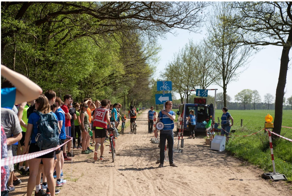
Medewerkers in actie tijdens de 47 e Batavierenrace

Dit is de groep vrijwilligers die helpen in de week voor, het weekend van en de week na de Batavierenrace. De groep varieert van mensen die al meer dan 25 edities betrokken zijn tot vrijwilligers die bij één editie helpen. De organisatiecommissie zorgt ervoor dat al deze medewerkers worden geworven, weten wat ze moeten doen en op welk tijdstip dat moet gebeuren.