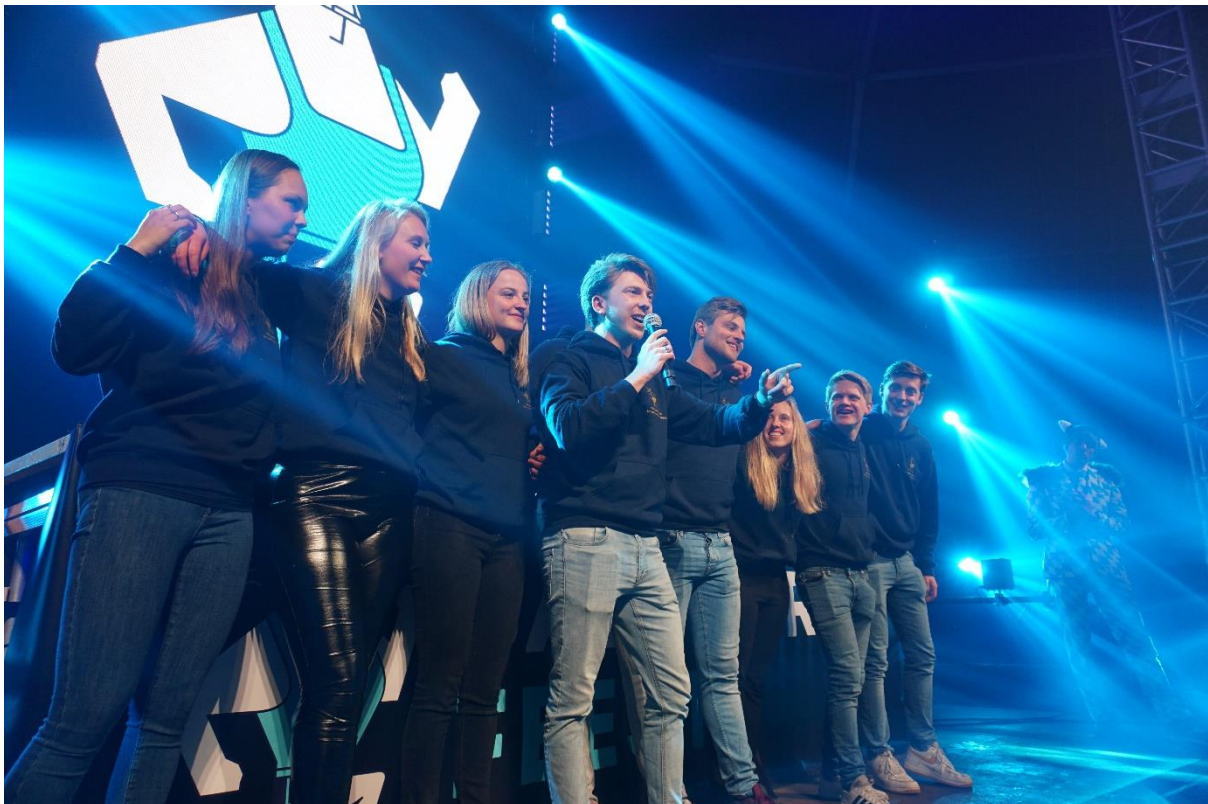
De 50e OC staat trots op het podium bij de prijsuitreiking