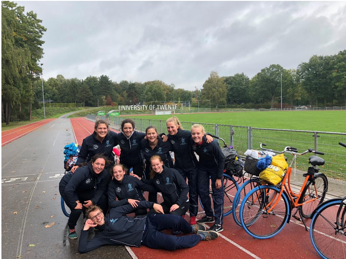
De 47 e OC op fietsrouteverkenning: twee dagen op Swapfietsen zwoegen, maar dan kom je ook ergens!

Zowel in Nijmegen als in Enschede kun je bestuursmaanden/bestuursbeurzen aanvragen voor je bestuursjaar bij de Batavierenrace. De regelingen verschillen per universiteit en het aantal beurzen wordt een keer in de paar jaar opnieuw bepaald en toegewezen. Als je hierover meer over wilt weten, dan kun je het beste even navraag doen bij de huidige OC in je stad.