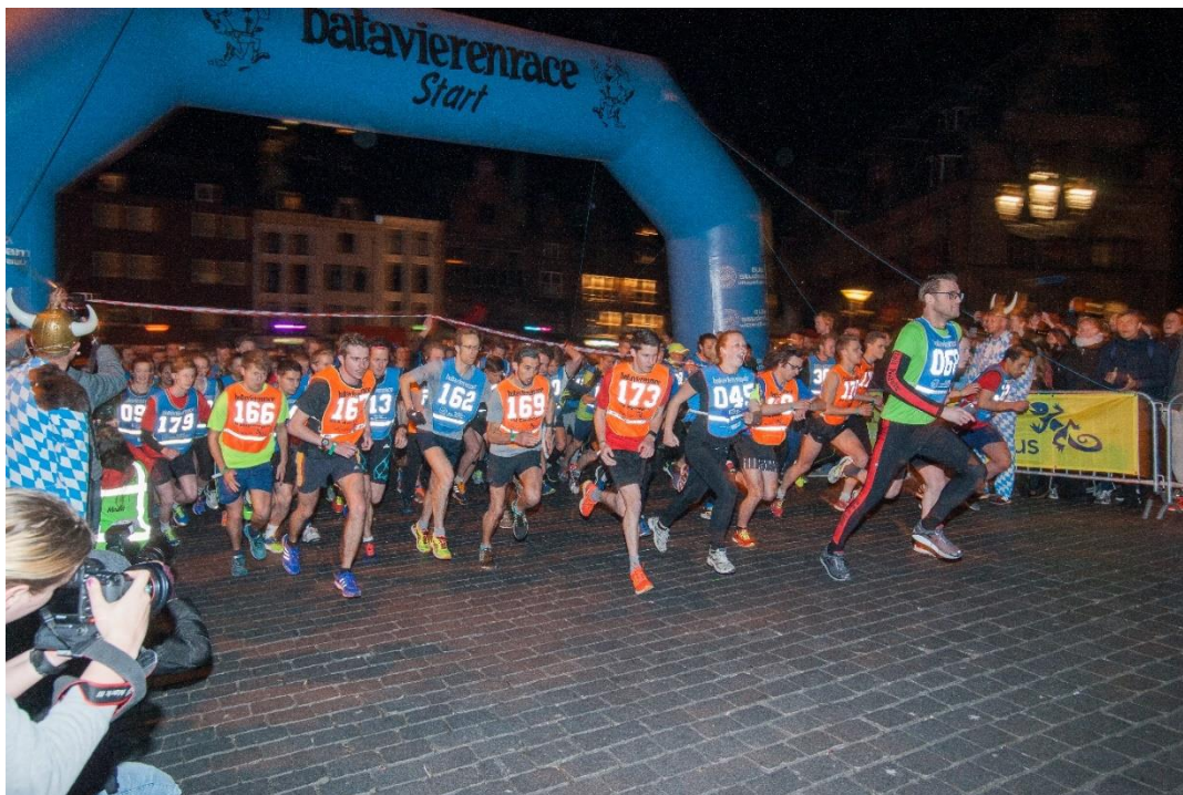
De centrumetappe; geef jezelf ook een mooie start en solliciteer!

De commissaris faciliteiten (FT/PT) houdt zich vooral bezig met de voorwaarden om de race heen . Je moet hierbij denken aan de volgende facilitaire elementen: aankleding/acts rondom de start, herstarts en finish, en ook onmisbare zaken zoals het regelen van eten en slaappleatsen voor deelnemers en medewerkers. Jij zorgt ervoor dat de Batavierenrace vernieuwend blijft. Als je net als de bovenstaande functie ook oplossingsgericht bent, maar je toch meer op het uiterlijk van de race wilt richten, is deze taak perfect voor je.