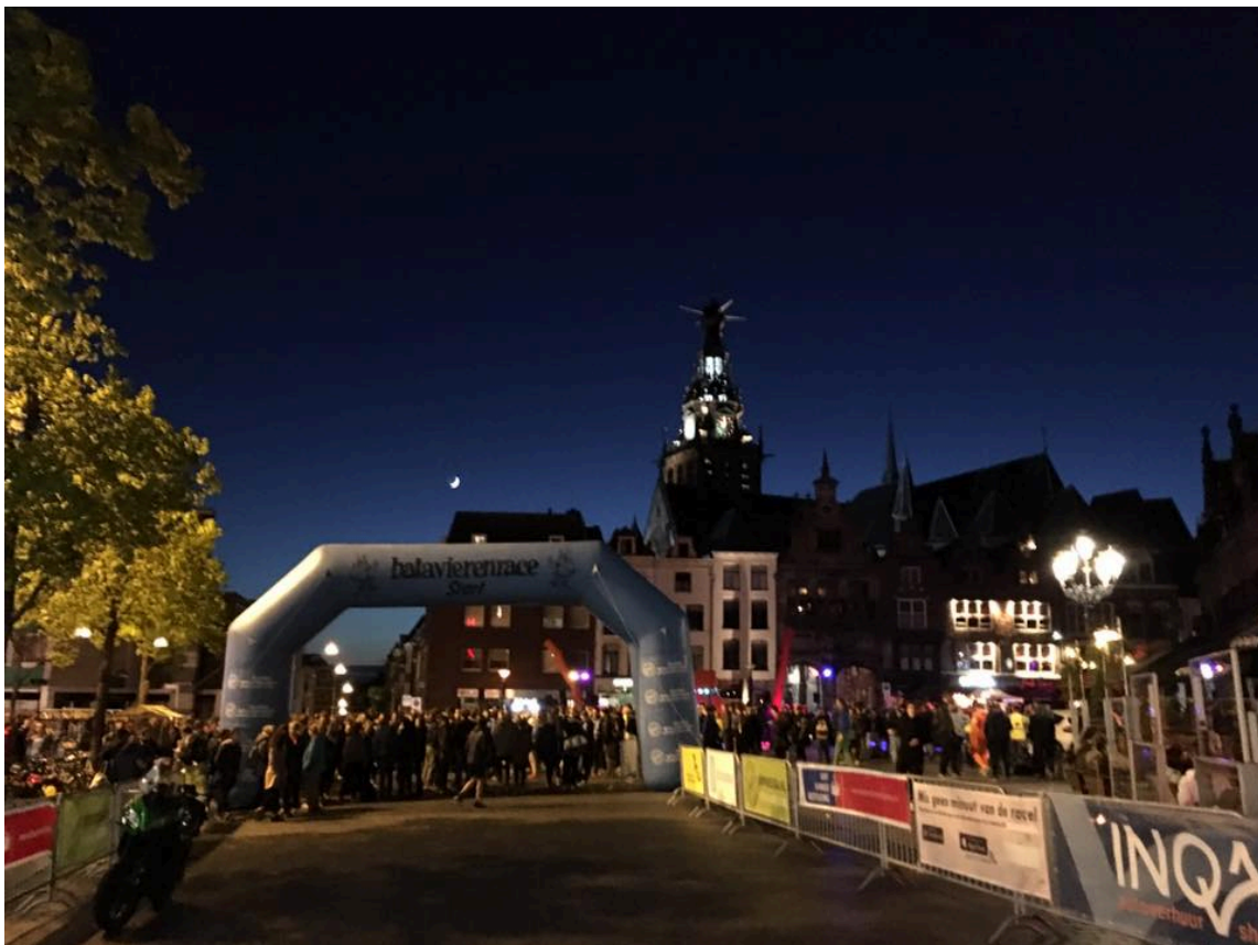
De centrumetappe; geef jezelf ook een mooie start en solliciteer!