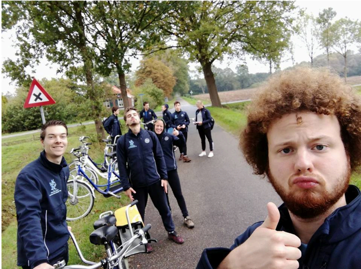
De 46 e OC op fietsrouteverkenning: twee dagen op tandems zwoegen, maar dan kom je ook ergens!

Zowel in Nijmegen als in Enschede kun je bestuursmaanden/bestuursbeurzen aanvragen voor je bestuursjaar bij de Batavierenrace. De regelingen verschillen per universiteit en het aantal beurzen wordt een keer in de paar jaar opnieuw bepaald en toegewezen. Als je hierover meer over wilt weten, dan kun je het beste even navraag doen bij de huidige OC in je stad.